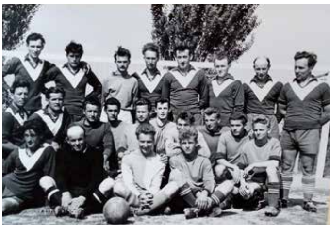
Nősek a nőtlenek ellen focimeccs